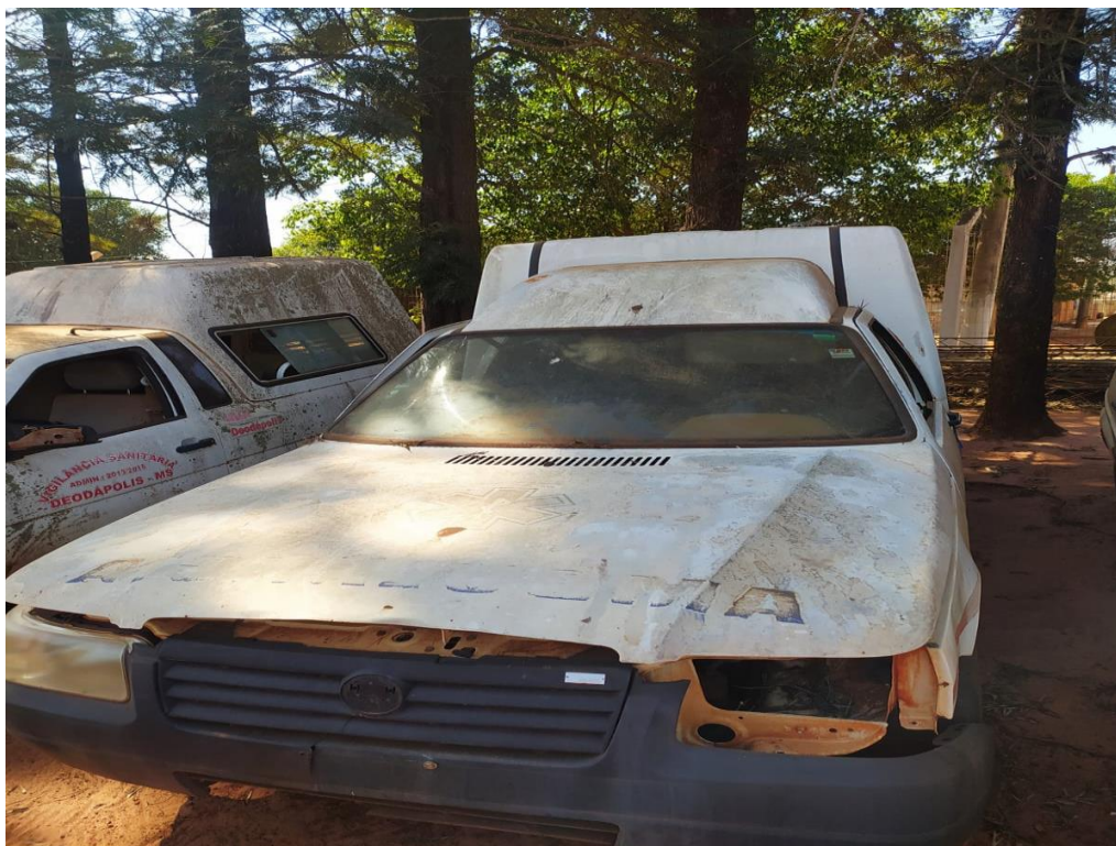
LOTE - 17 FIAT FIORINO FLEX. COR BRANCA. ANO 2008. (SUCATA) VALOR INICIAL R$ 0,95 kg