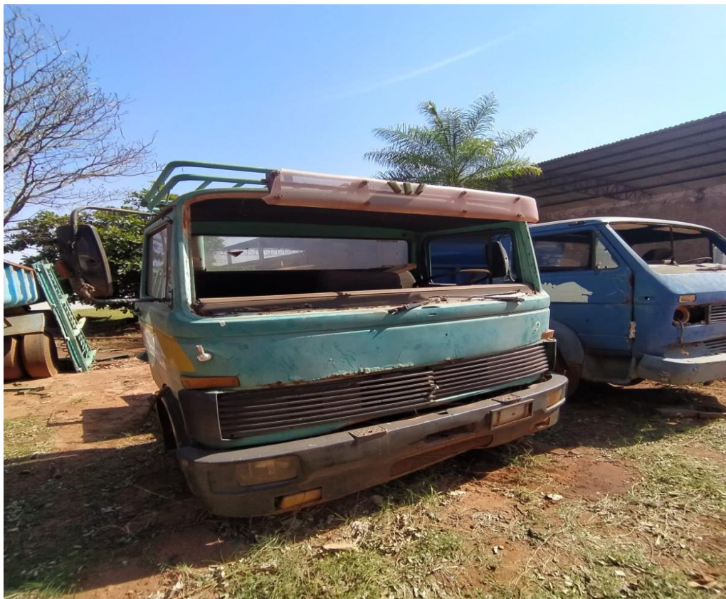
LOTE - 23 CAMINHÃO MERCEDES BENZ. COR VERDE. (SUCATA) VALOR INICIAL R$ 0,95 kg