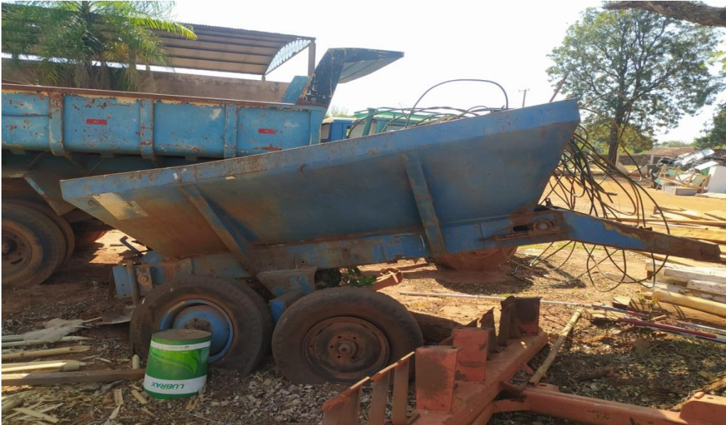
LOTE - 07 DISTRIBUIDOR DE CALCÁRIO PH-2700 VALOR INICIAL R$ 2.500,00