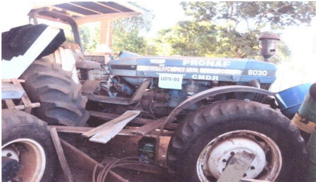
LOTE - 03 TRATOR NEW HOLLAND 80308.D-1 VALOR INICIAL R$ 11.000,00