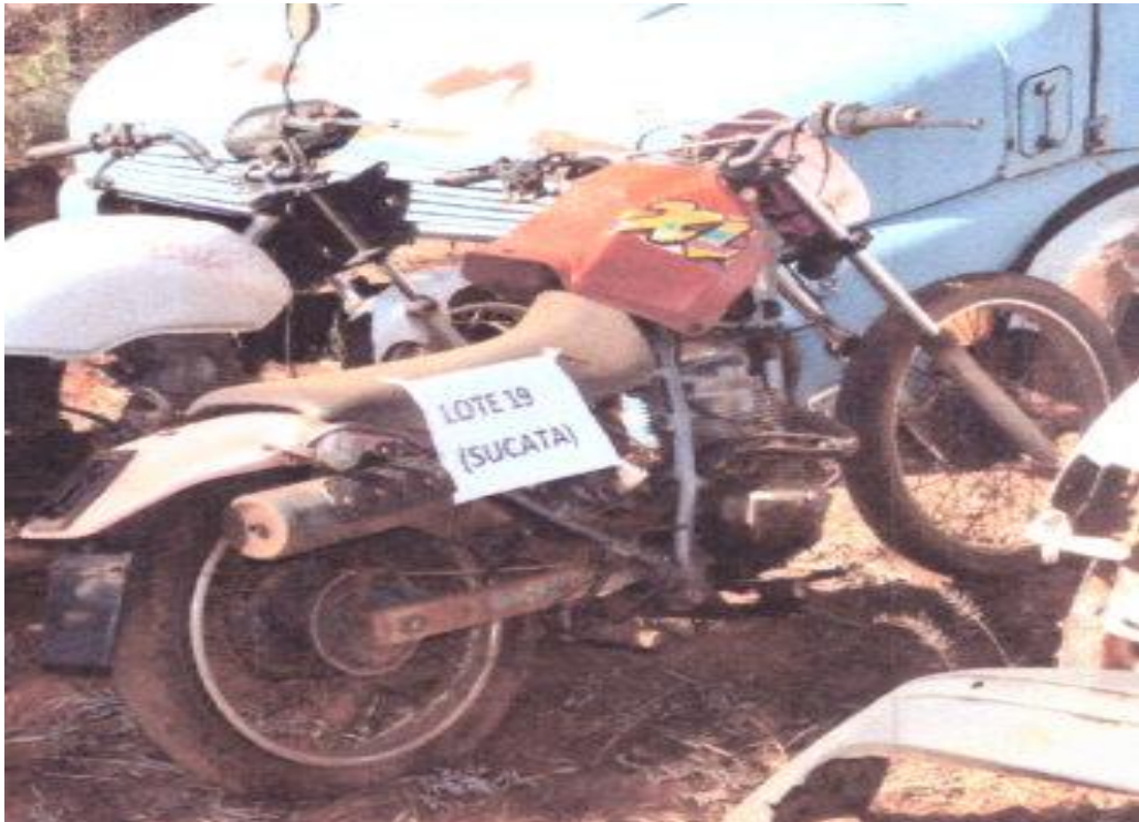
LOTE - 19 MOTO XLR. COR VERMELHA. ANO 1998 (SUCATA) VALOR INICIAL R$ 0,95 kg