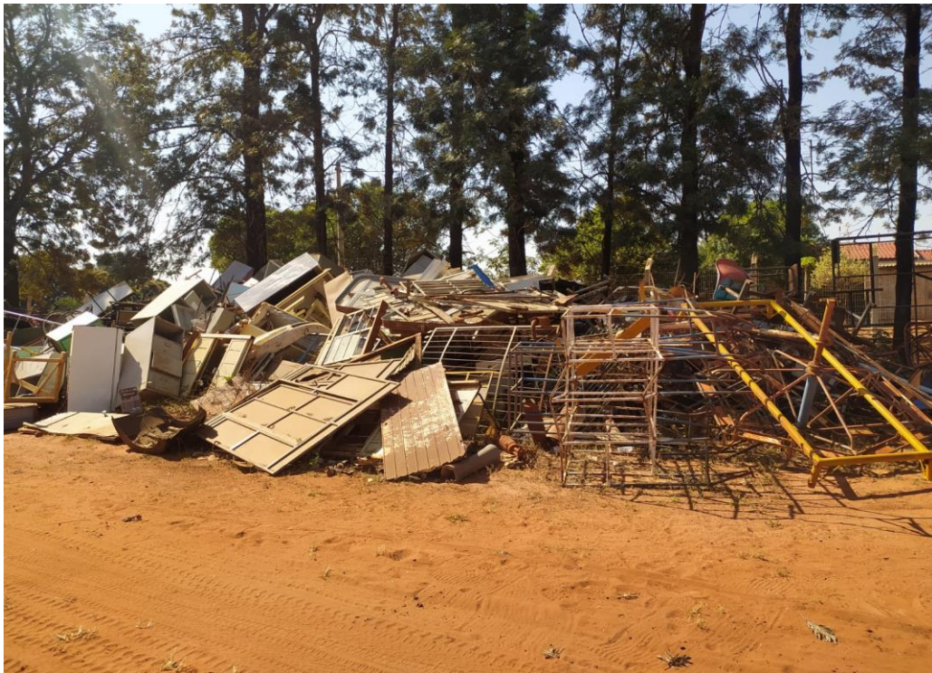
LOTE - 24 SUCATAS DIVERSAS VALOR INICIAL R$ 0,95 kg