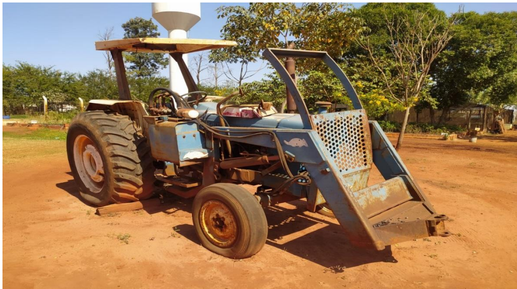
LOTE - 04 TRATOR FORD 6600. AZUL. VALOR INICIAL R$ 5.000,00