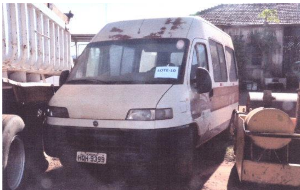
LOTE - 10 FIAT DUCATO BRANCA ANO 2004 VALOR INICIAL R$ 7.000,00