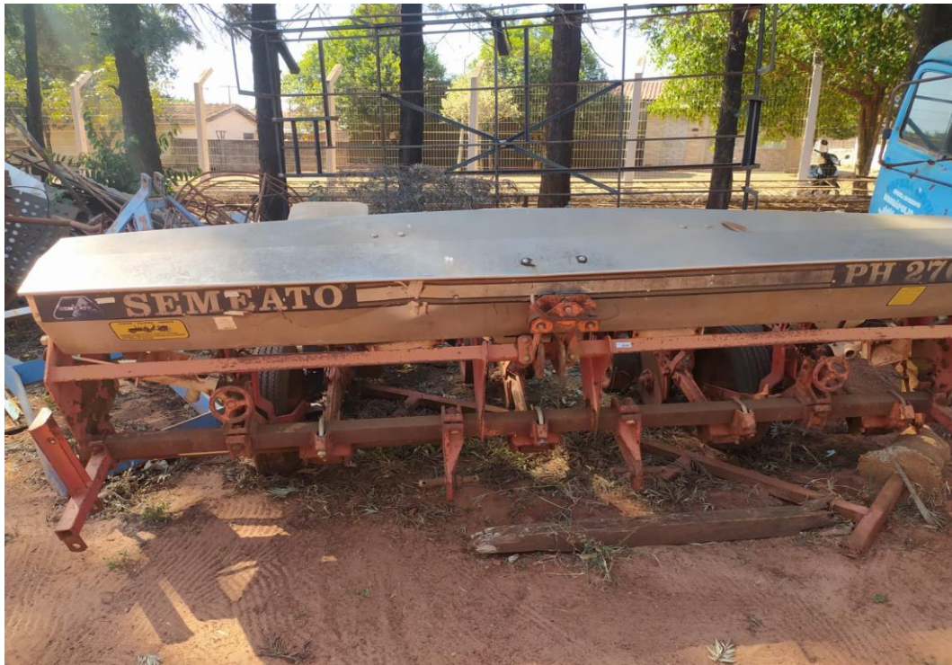
LOTE - 06 PLANTADEIRA SEMEATO DE 4 LINHAS VALOR INICIAL R$ 1.500,00