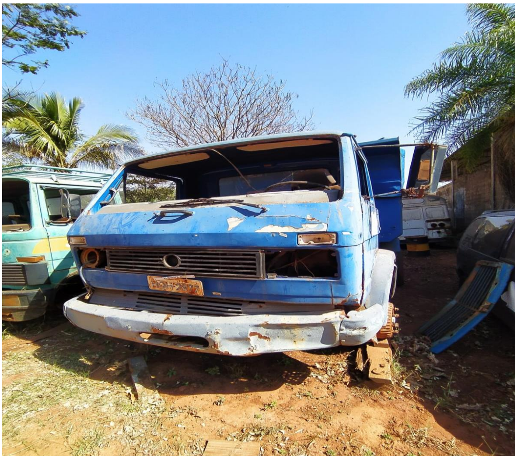
LOTE - 09 CAMINHÃO VOLKS CAÇAMBA 11130 VALOR INICIAL R$ 5.000,00