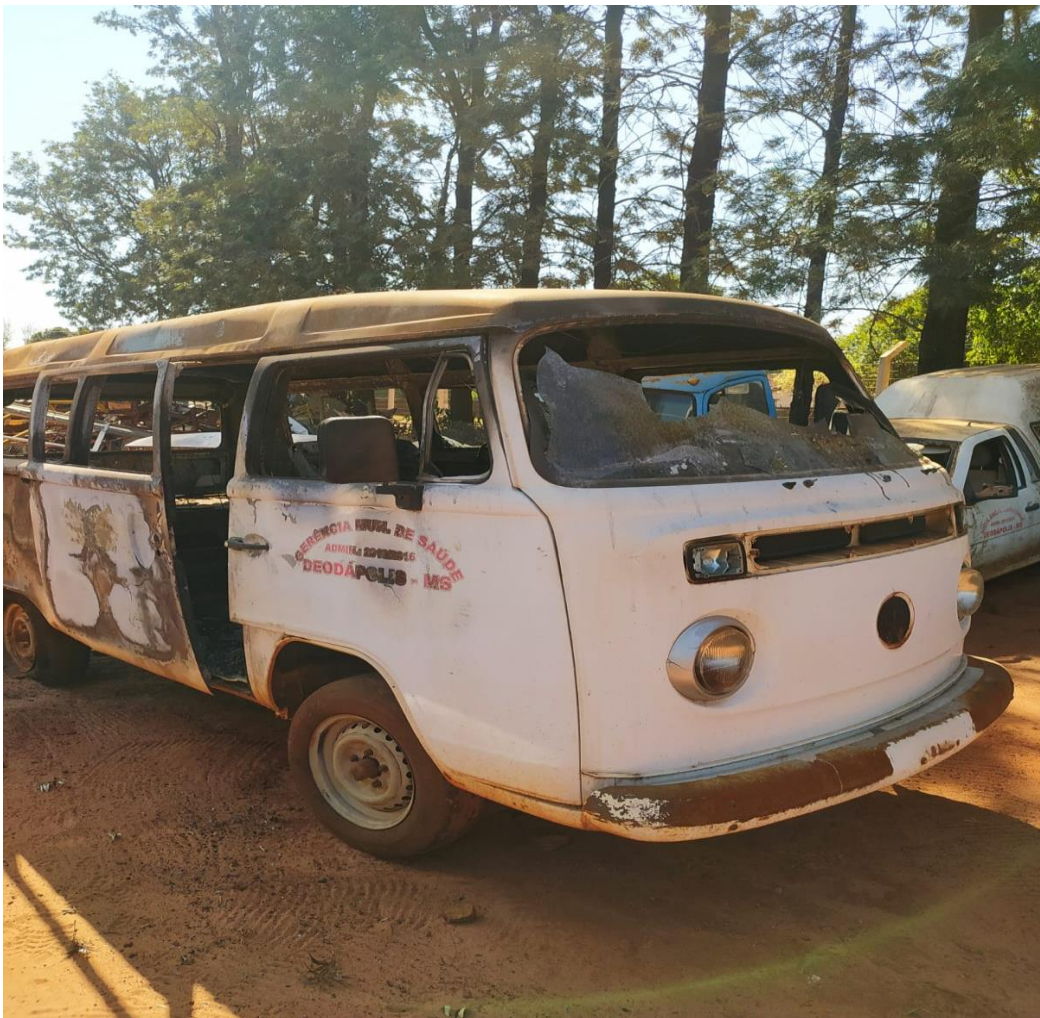
LOTE - 18 KOMBI - 2 . COR BRANCA. (SUCATA) VALOR INICIAL R$ 0,95 kg