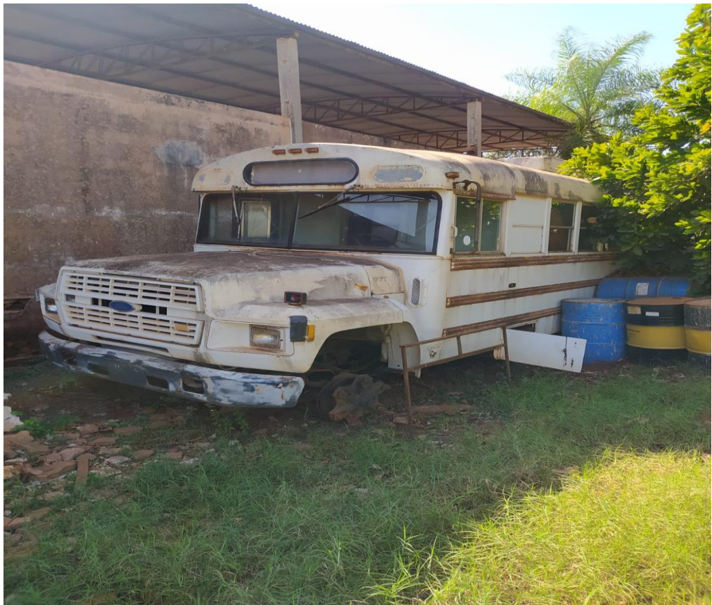
LOTE - 12 ÔNIBUS FORD IMP (SCOO BUS) ANO 1987 (SUCATA) VALOR INICIAL R$ 0,95 kg