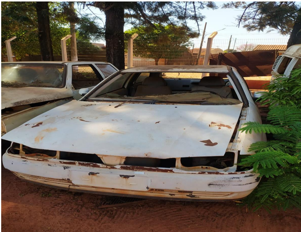
LOTE - 15 VW GOL ESPECIAL. COR BRANCA. ANO 2001-2002. (SUCATA) VALOR INICIAL R$ 0,95 kg