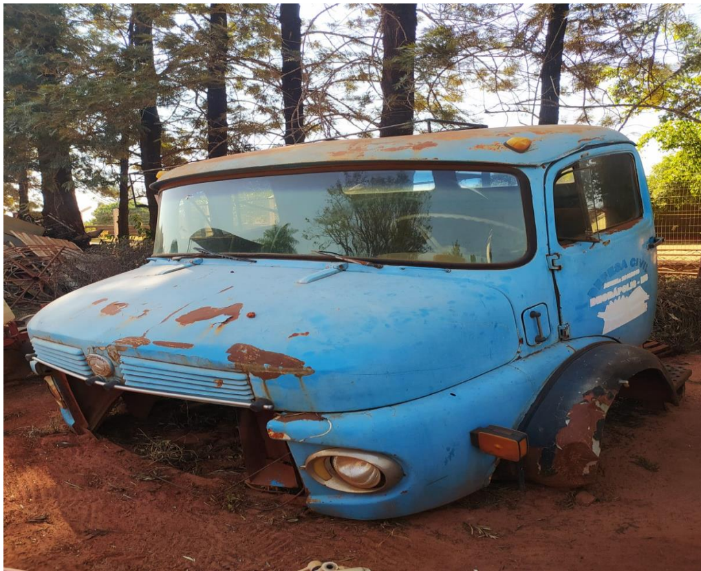
LOTE - 13 CABINE CAMINHÃO MERCEDES BENZ. ANO 1971. (SUCATA) VALOR INICIAL R$ 0,95 kg