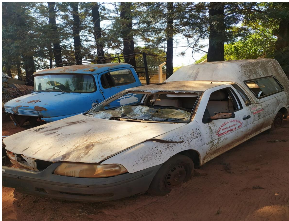
LOTE - 21 SAVEIRO AMBULANCIA. COR BRANCA. ANO 2001. (SUCATA) VALOR INICIAL R$ 0,95 kg