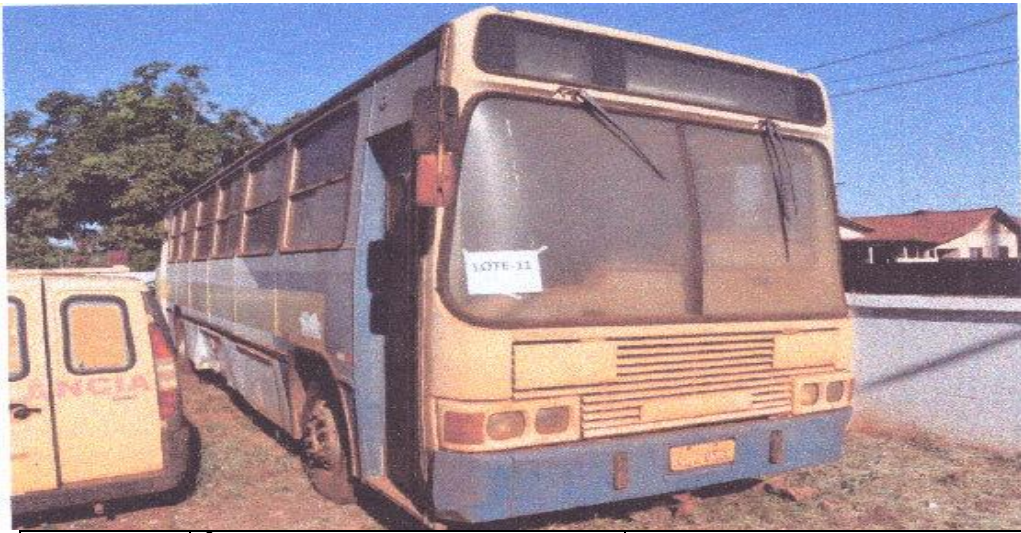
LOTE - 11 ÔNIBUS ESCOLAR SCANIA. ANO 1993. VALOR INICIAL R$ 7.000,00