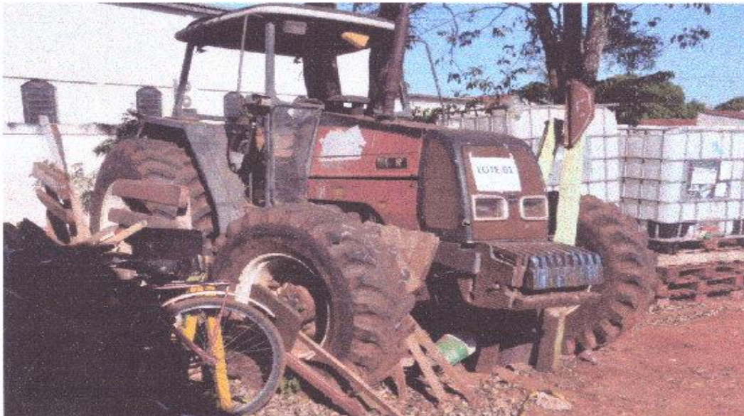
LOTE - 01 TRATOR VALTRA BM. VERMELHO VALOR INICIAL R$ 12.000,00