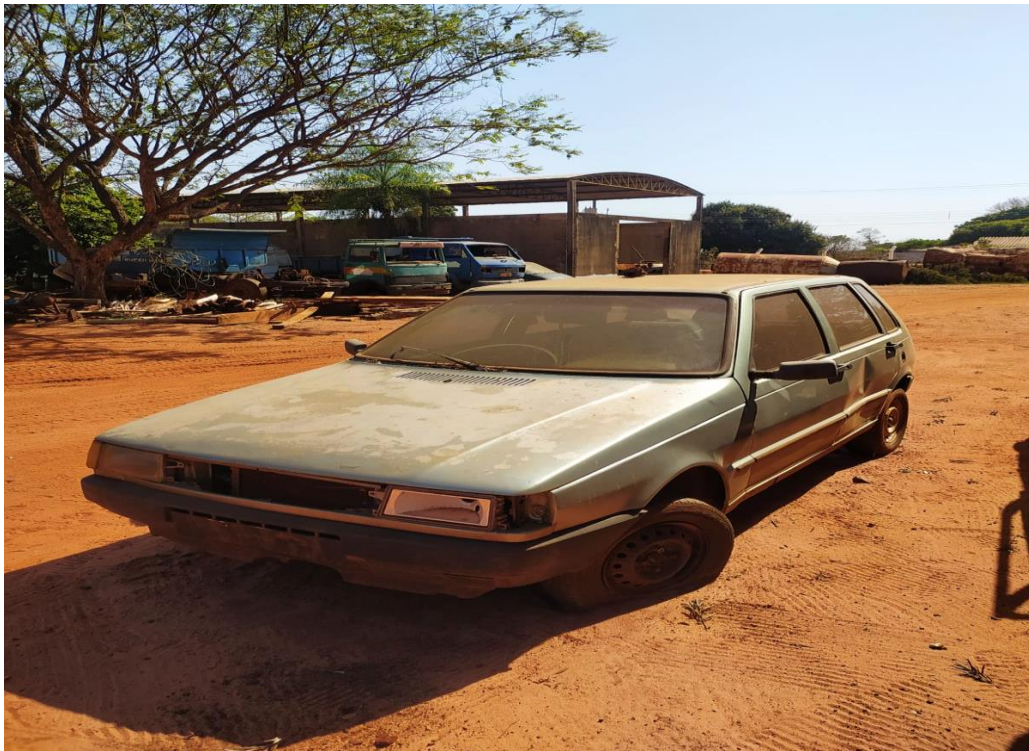
LOTE - 14 FIAT UNO. COR VERDE. ANO 1994. (SUCATA) VALOR INICIAL R$ 0,95 kg