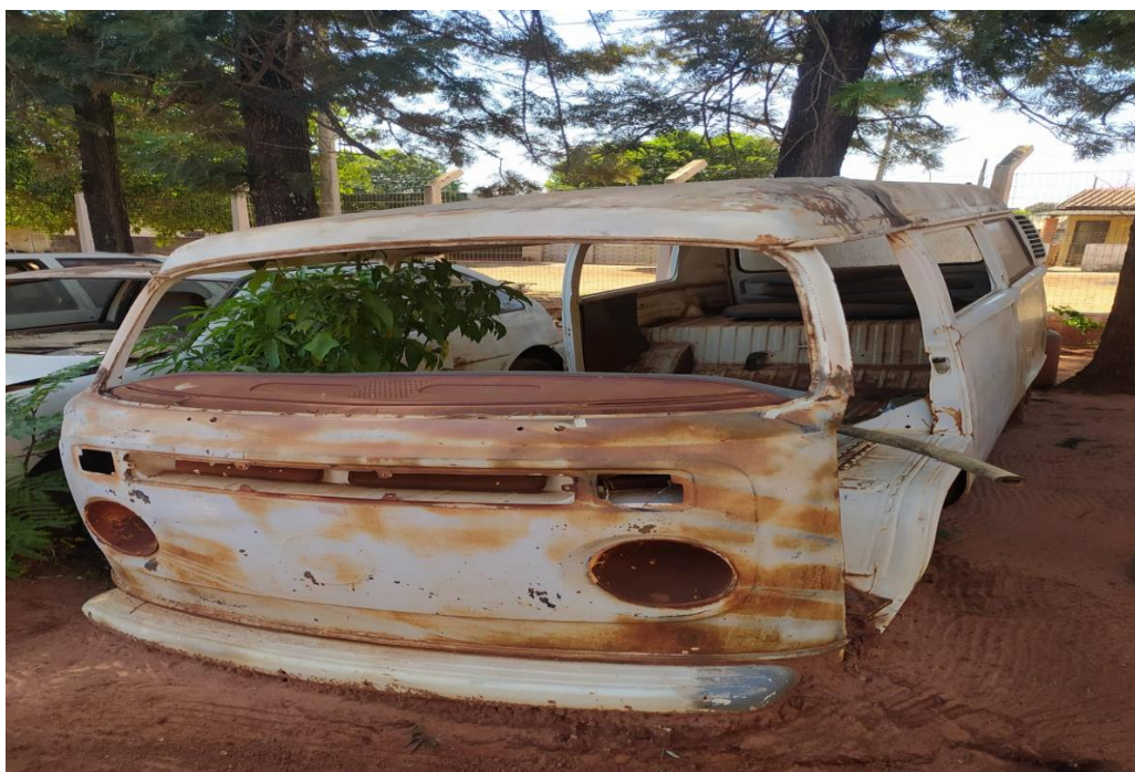
LOTE - 18 KOMBI 1 (CARÇAÇA). COR BRANCA. (SUCATA) VALOR INICIAL R$ 0,95 kg