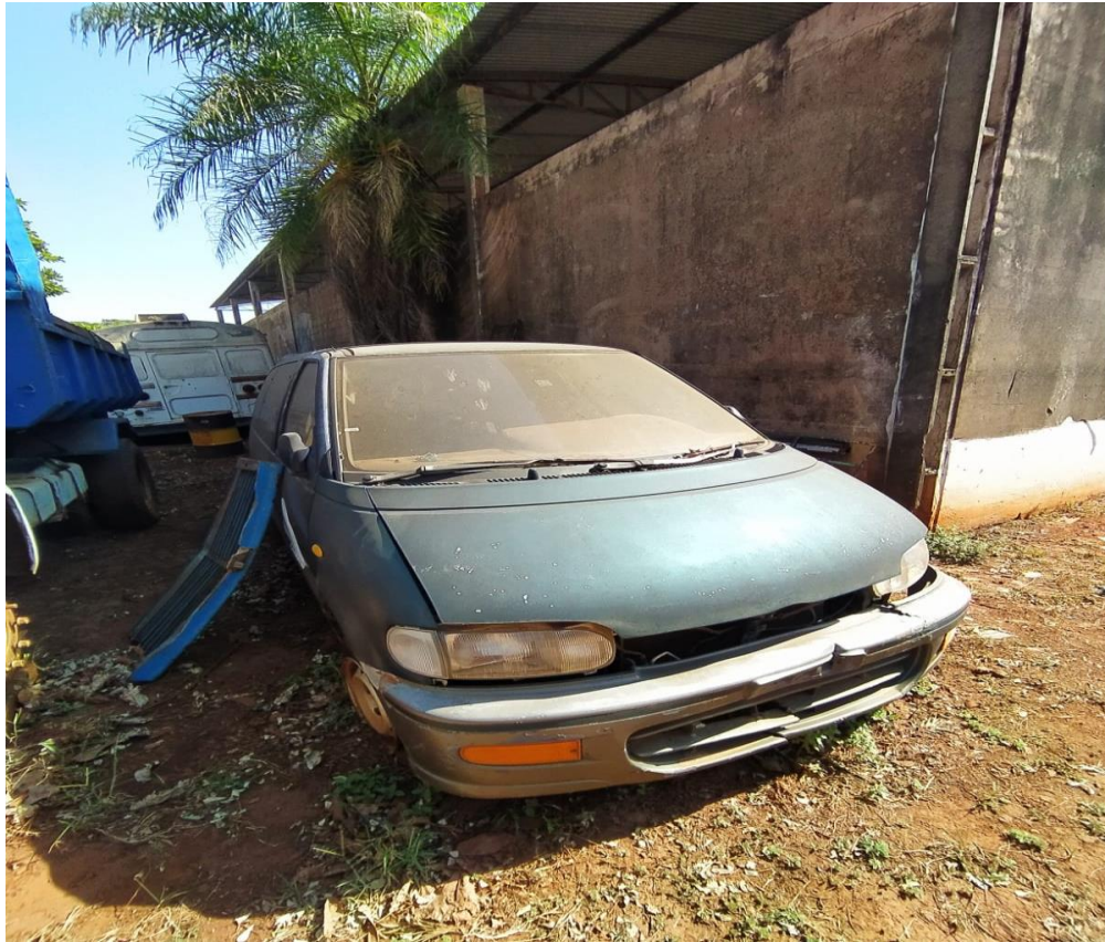
LOTE - 22 NISSAN SERENA. COR VERDE. (SUCATA) VALOR INICIAL R$ 0,95 kg