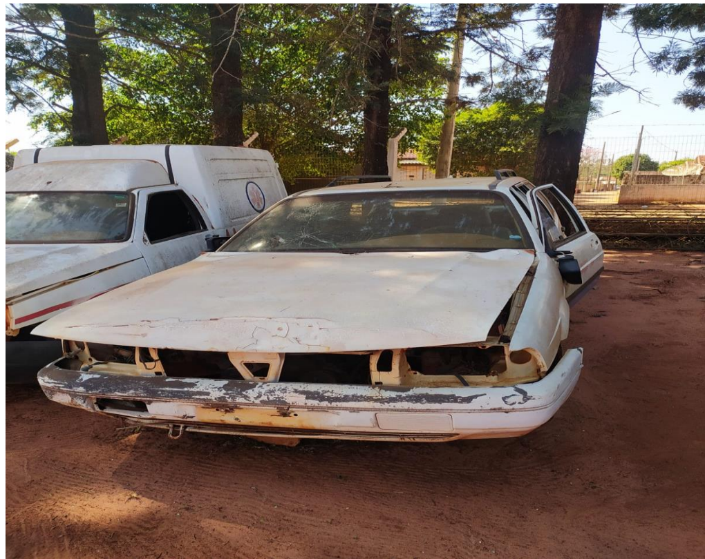
LOTE - 16 VW SANTANA QUANTUM. COR BRANCA. ANO 1997. (SUCATA) VALOR INICIAL R$ 0,95 kg