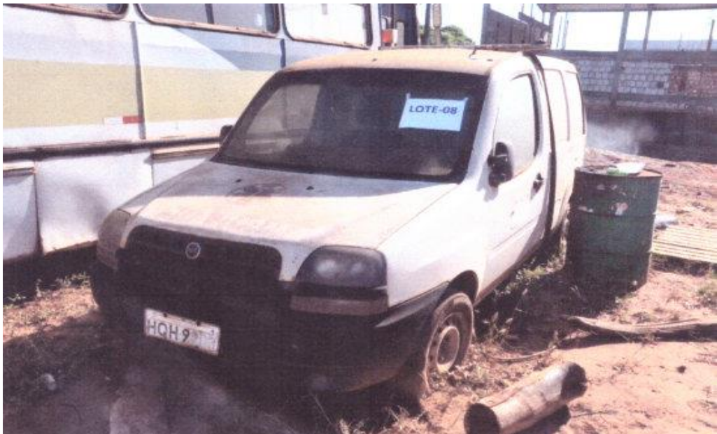
LOTE - 08 FIAT DOBLO. BRANCA VALOR INICIAL R$ 5.000,00