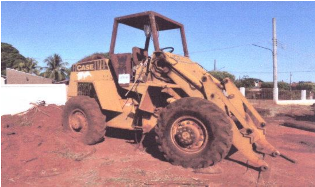
LOTE - 05 PÁ CARREGADEIRA W-18 VALOR INICIAL R$ 15.000,00