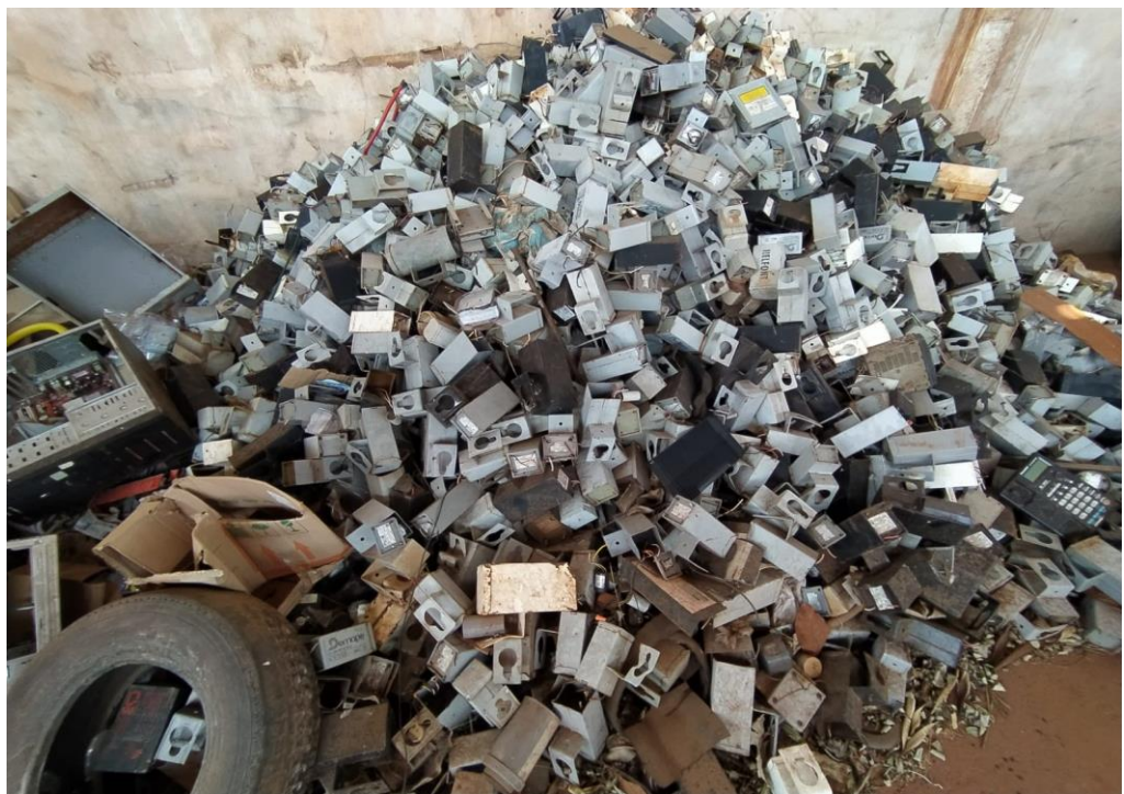
LOTE - 25 SUCATA (EQUIPAMENTOS ELÉTRICOS CONTENDO REATORES INUTILIZÁVEIS) VALOR INICIAL R$ 0,95 kg